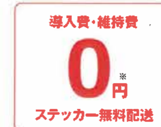
※別途決済手数料・入金手数料が発生します。

紙のステッカーを設置するだけ！スマホやタブレットなどお持ちの端末があれば、無料でお店に導入できます。