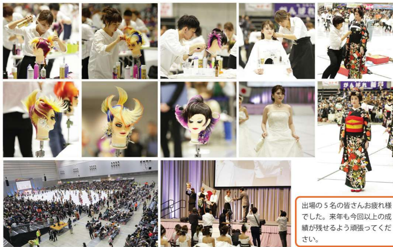
出場の5名の皆さんお疲れ様でした。来年も今回以上の成績が残せるよう頑張ってください。